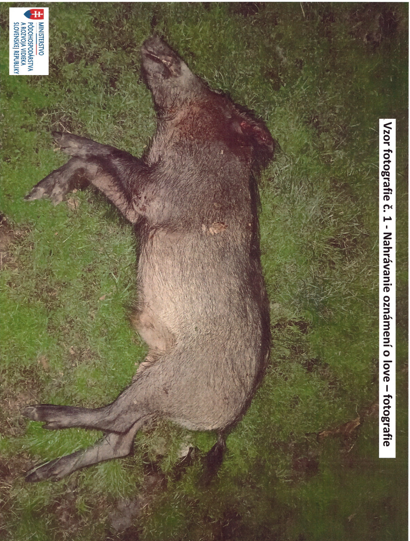
Vzor fotografie č. 1 - Nahrávanie oznámení o love – fotografie